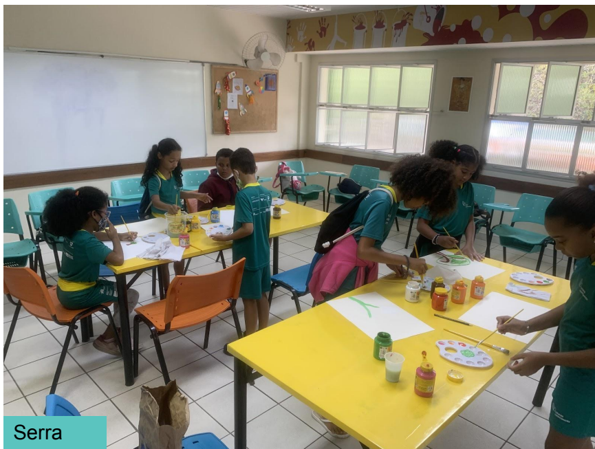
Oficina: Arte e Cultura (Corpo, arte e movimento)