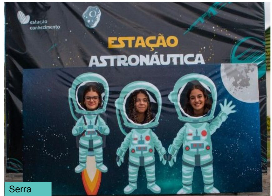
Festa do Céu