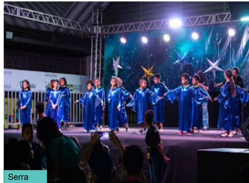
Festa do Céu