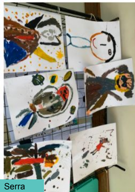
Oficina: Multimeios (Corpo, arte movimento)