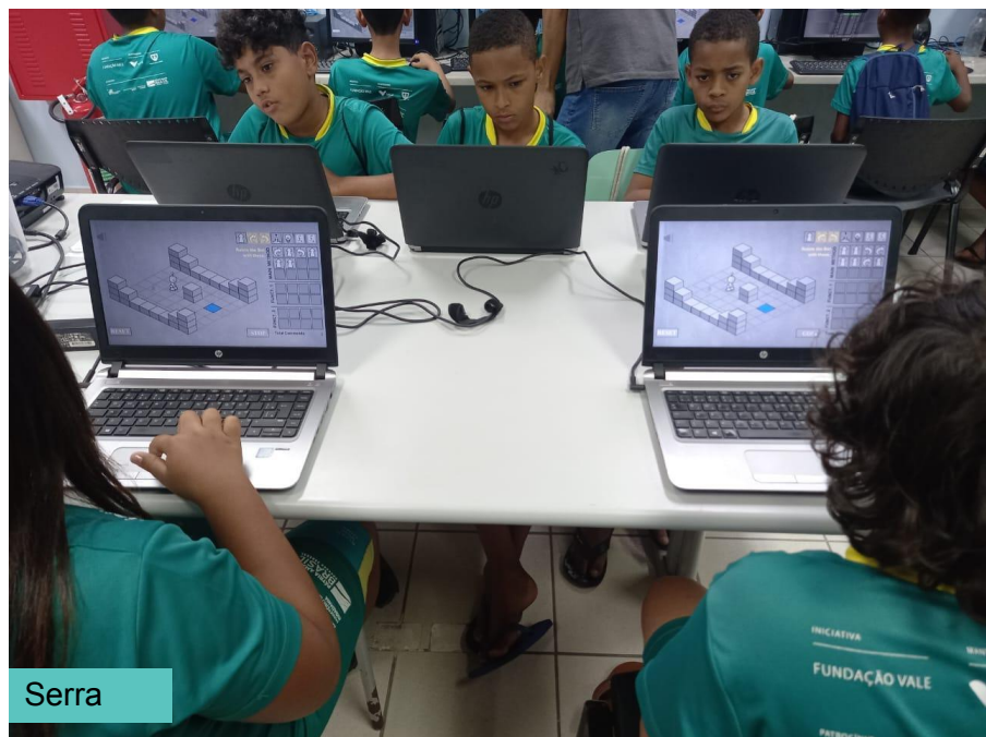
Oficina: Inclusão Digital