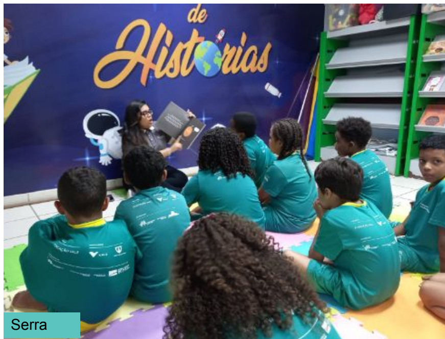
Oficina: Era uma vez