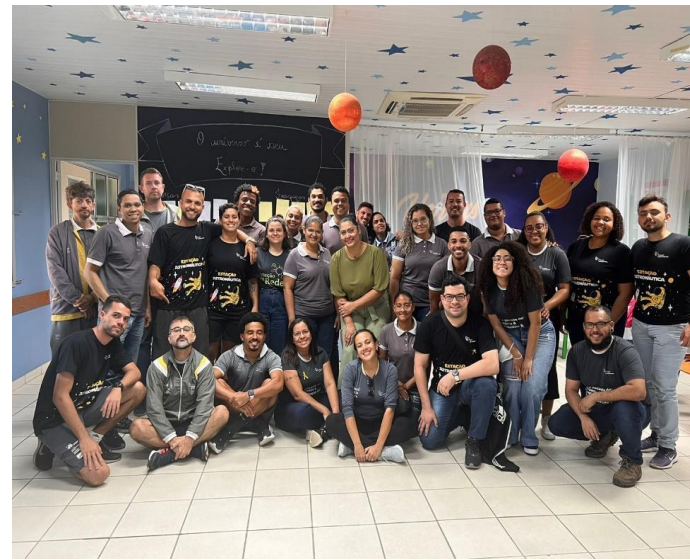
Capacitações - 2 Ciclo sobre cultura e Capacitação de Educação Inclusiva