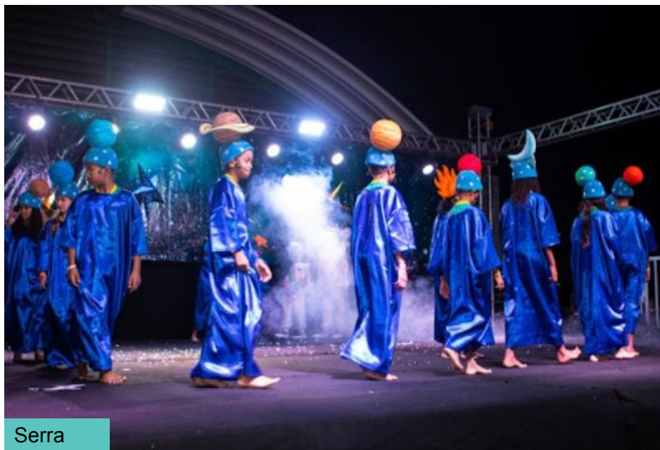
Festa do Céu