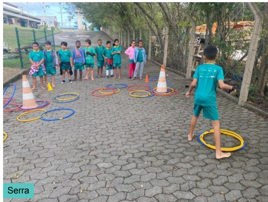
Oficina: Ludicidade (Corpo, arte e movimento)