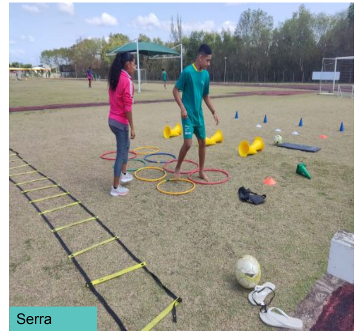
Atividade- Adaptação para inserção no esporte